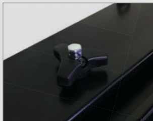
スタンド天面・高さ調整ノブ (電動ドライバーなどで回転操作)