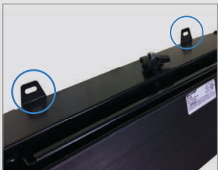
スタンド上部・アンカー固定穴 (2ヶ所)

床面と壁面に、合計4箇所のアンカー固定が可能。超大型ディスプレイ利用時のスタンドの揺れを大幅に軽減することができます。(床用アンカーはフロントパネルを取り外して施工)