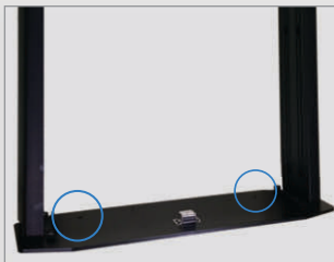
フロントパネル内アンカー固定穴 (2ヶ所)